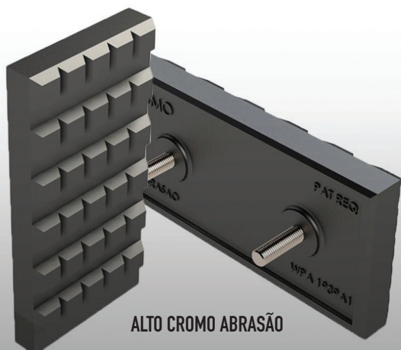
ALTO CROMO ABRASÃO