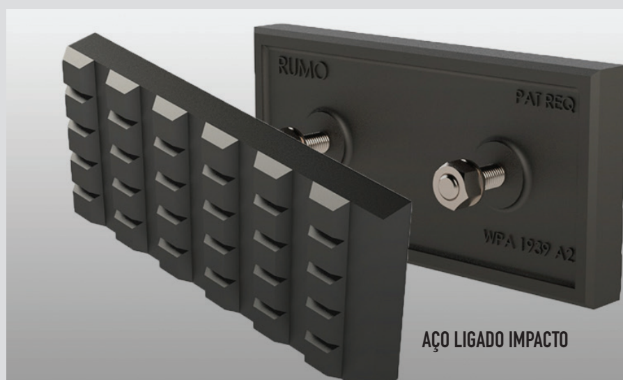
AÇO LIGADO IMPACTO

A RUMO INDUSTRIAL desenvolve SOLUÇÕES CONTRA O DESGASTE que atendem todos os perfis de aplicações. São PRODUTOS exclusivos e com excelentes características de resistência ao desgaste.